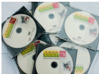
Holzgerlingen-DVD: 10 Euro