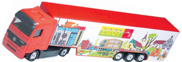
Sammler-Truck: 4,20 Euro