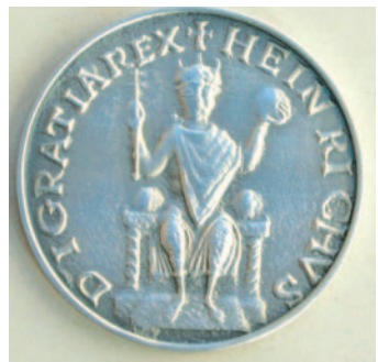
24,50 bis 198 Euro: Medaillen