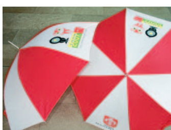
Schirm: 7 Euro