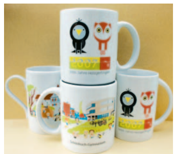
Kaffeebecher: 4 Euro