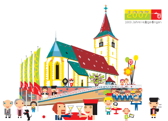
Post- und Grußkarten: 0,80 / 1,80