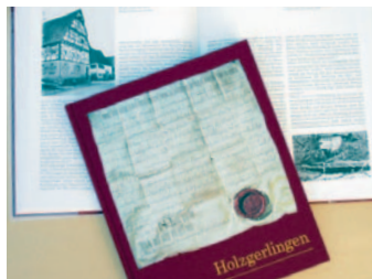
Heimatbuch: 19 Euro