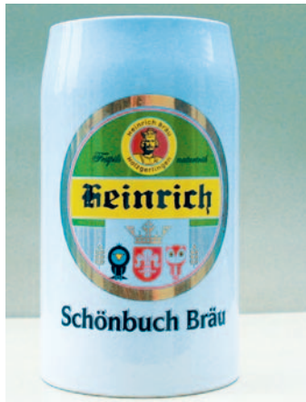
Heinrich-Krug: 4 Euro

Verwandten nach Holzgerlingen einladen wollte – das Jubiläumsjahr böte Anreize genug. Auch ein Sammlerstück für Kinder gibt es: den limitierten Holzgerlinger Truck. Schon vom Holzgerlinger Herbst her bekannt ist der Festkrug fürs Heinrich-Bier. Ein Button mit Eule und Rabe gilt gleichzeitig als Eintrittskarte für den historischen Festumzug am 1. Juli, permanent ans Revers geheftet werden kann das Festlogo als Ansteck-Pin. Außerdem gibt's zum Holzgerlinger Jubiläum Schirme und bei den Banken Medaillen... red/mmu